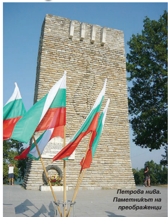
Петрова нива. Паметникът на преобразенци