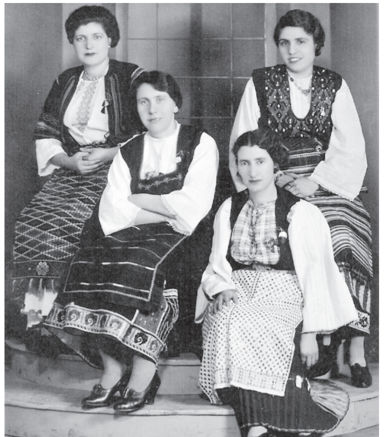
След тракийска седянка, 1935 г.