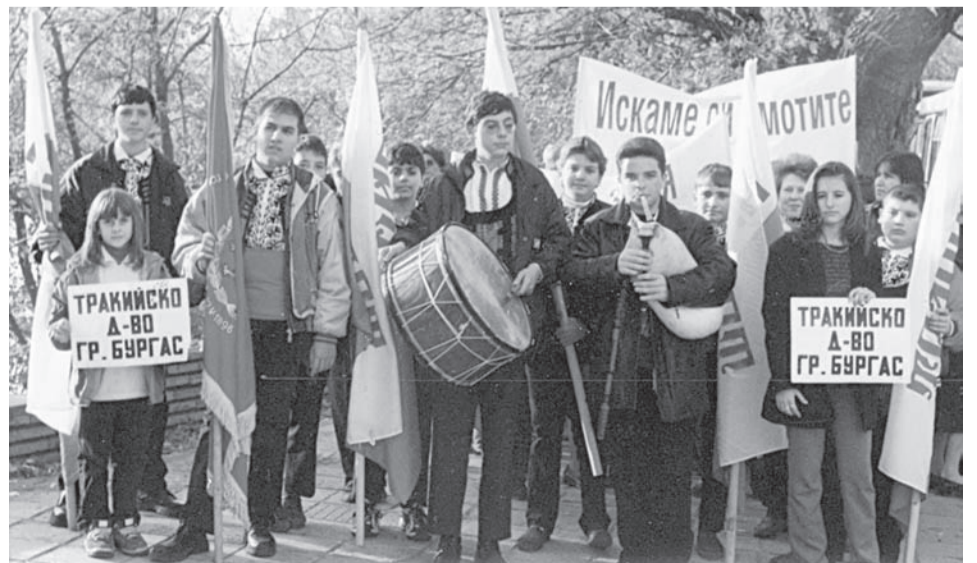
Днешните достойни потомци на бежанците