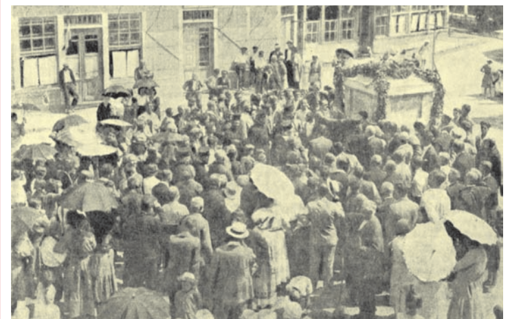
Откриване на централната чешма в Месемврия (днес Несебър)