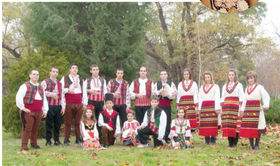
Най-младите членове на бургаското тракийско гружество

Бургаското тракийско гружество навършва 115 години. Разбира се, не годините определят неговата същност, значимост и влияние, но те са отражение на неговата достолепност и зрялост. Изминатият път е олицетворение на различни исторически периоди, кратки отрязки от вековен път на изграждане и развитие. Той е израз на идея, дълбоко вкоренена в душите и сърцата на хората, скътали обичта към родната земя през тежките години на прокудата, пренесли вярата си през жестоките изпитания на бежанството, запазили духа си през трагичните периоди на оцеляването. Идея, чиято същност побеждава във всяко сражение и чиято истина се съдържа в мечтите на всички поколения тракийци.