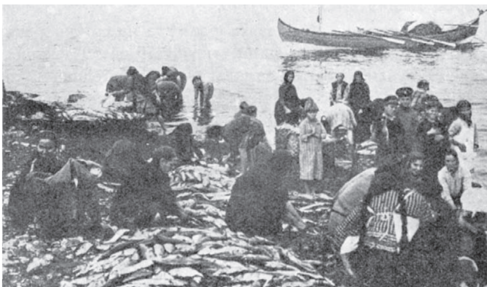
Тракийци на риболов в първата половина на XX век

които обединяват хората, нямаше да ги има многото тракийски домове, които са се превърнали в част от България, в част от нас. Архивите са пълни с цифри, имена, събития. Трудно е да изредим всички. Но с тях тракийци живеят 115 години. Във всеки ден от тези 115 години тракийската земя е била изпълнена със стъпките на тракийци и техните потомци - земя с граници, в която продължават да се раждат тракийци, и дух без граници, който търси упование в паметта и в новите измерения на днешния ден.