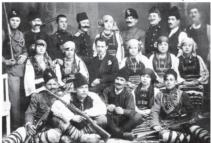
Тракийската театрална трупа, 1930 г., Карнобат