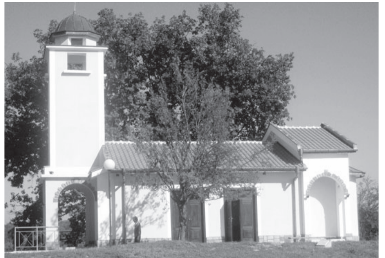
Петрова нива. Църквата „Св. Петка“