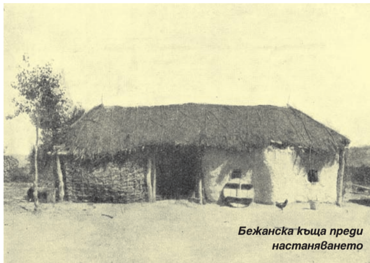
Бежанска къща преди настаняването