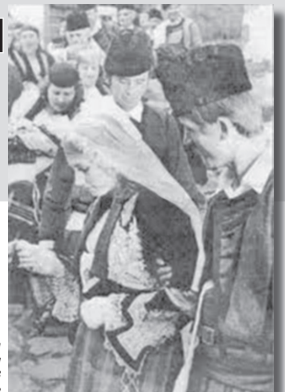
Сватба на българи мохамедани в Рогопите