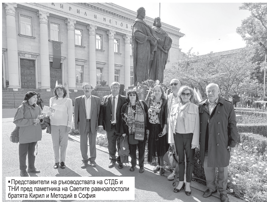
▪ Представители на ръководствата на СТДБ и ТНИ пред паметника на Светите равноапостоли братята Кирил и Методий в София

Тракийци в цялата страна – Варна, Бургас, Пловдив, Хасково, Харманли, Стара Загора, Ямбол, Димитровград, Търговище, Средец, Созопол, Ивайловград, Крумовград и др., се включиха в празничните общоградски шествия и тържества.