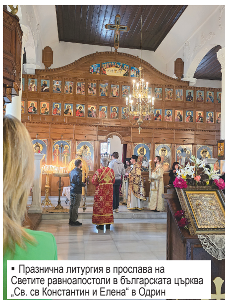
▪ Празнична литургия в прослава на Светите равноапостоли в българската църква „Св. св Константин и Елена“ в Одрин