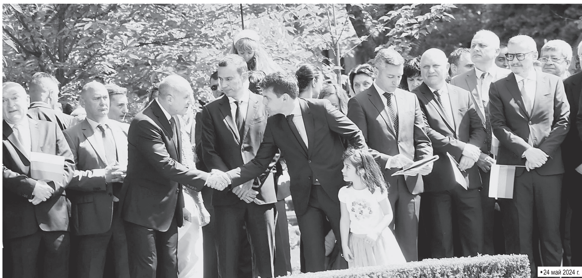
▪ 24 май 2024 г.