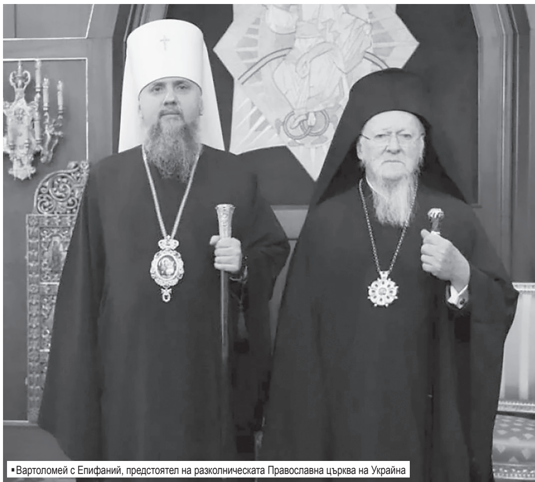
Вартоломей с Епифаний, предстоятел на разколническата Православна църква на Украйна

В крайна сметка смисълът на нашия живот е не да векуваме тук. Смисълът на нашия живот е да живеем с истината и да свидетелстваме за тази истина. Как ще свидетелстваме за истината, ако с намесата на чужди предстоятели в делата на друга Църква нарушаваме 8 правило на Третия вселенски събор, което казва да не губим тази свобода, която сме получили от Исус Христос? Той ни е дал свобода и в един момент, когато под такива действия на властолюбие, на властване, се допусне това, то е пречка за спасението на човешките души. Защото когато човекът се съединява с лъжа, когато започне да се ръководи от страх, поведението на човека се променя. Господ казва, „ще познаете истината, и истината ще ви направи свободни“ (Иоан. 8:32), а не, който не дойде при Мен и