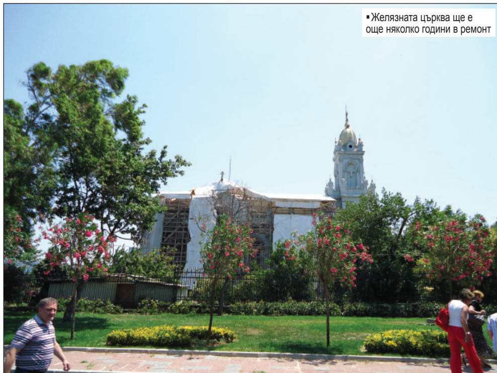
■ Желязната църква ще е още няколко години в ремонт

Храм със славно минало, той и днес дава самочувствие и гордост на българите, независимо дали са в България, или разпилени по целия свят. Църквата се издига в кв. „Фенер“, на самия бряг на