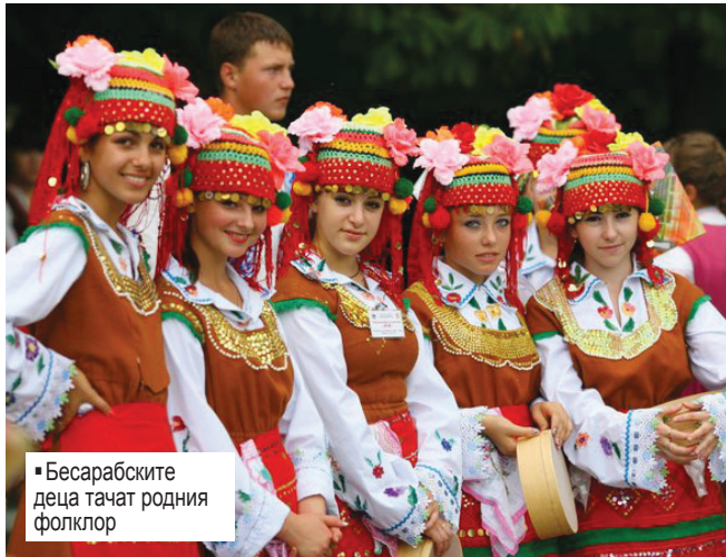
Бесарабските деца тачат родния фолклор