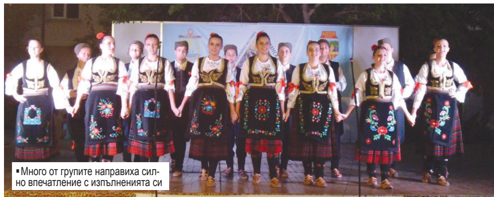
• Много от групите направиха силно впечатление с изпълненията си