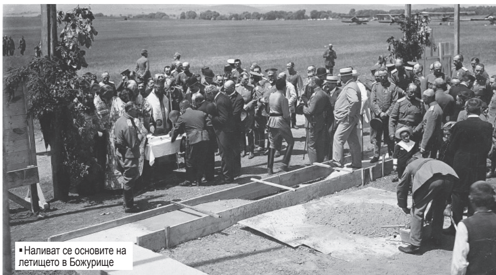
Наливат се основите на летището в Божурище