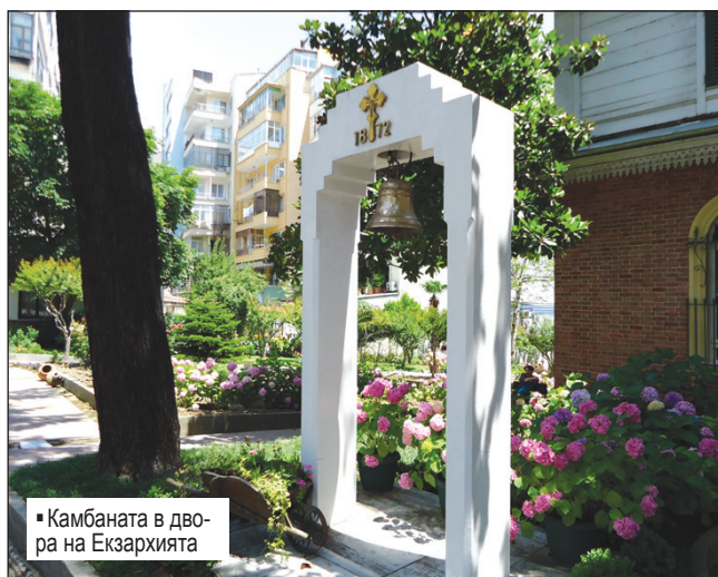
■ Камбаната в двора на Екзархията

На първия етаж в Екзархийския дом се намира кабинетът на Екзарх Йосиф. Той е съхранен в автентичния си вид и с гордост е показван на посетителите. Запазени са всички мебели, включително писалището и касата с четири ключалки, чиито ключове били пазени от четирима от настоятелите. На видно място е окачен и прочутият Ферман, с който султан Абдул – Азис признава българите като отделен етнос с право на самостоятелна църква, начело с български духовен глава. В съседство е кабинетът на председателя на сегашното Църковно настоятелство,