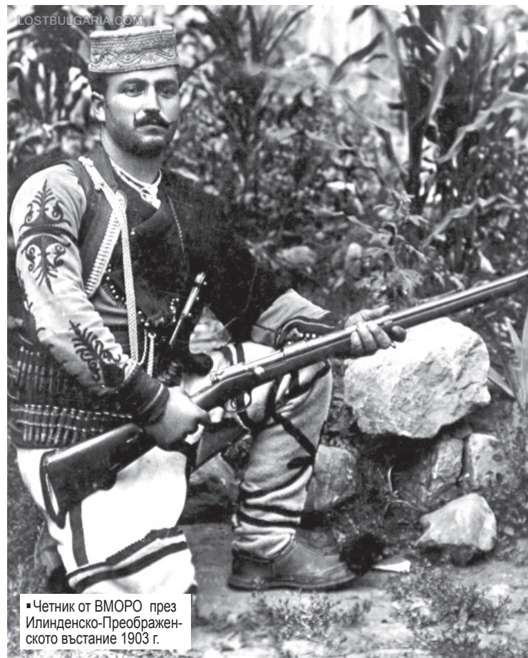
Четник от ВМОРО през Илинденско-Преображенското въстание 1903 г.