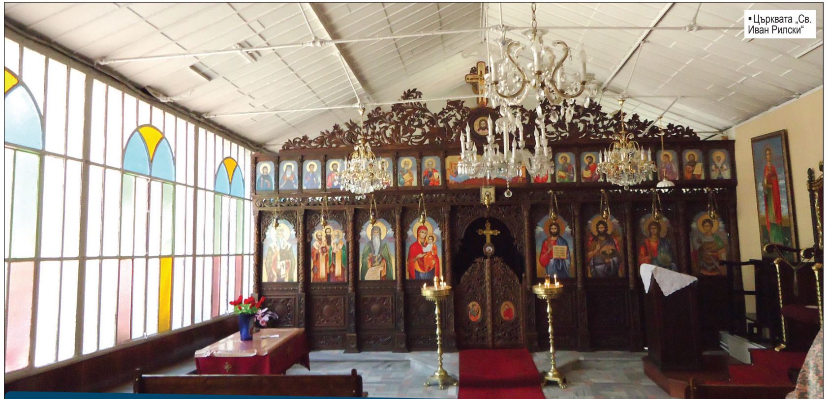
■ Църквата „Св. Иван Рилски“

Разположена сред обширен, потънал в зеленина двор, скрита от любопитните очи и шумния делник, в истанбулския квартал „Шишли“ се издига красива бяла сграда. Тя е закупена през 1907 г. по инициатива на Екзарх Йосиф. Дотогава екзархийската канцелария се помещавала в квартал „Ортакьой“. Там се провел през 1871 г. първият църковно-народен събор, избрал за