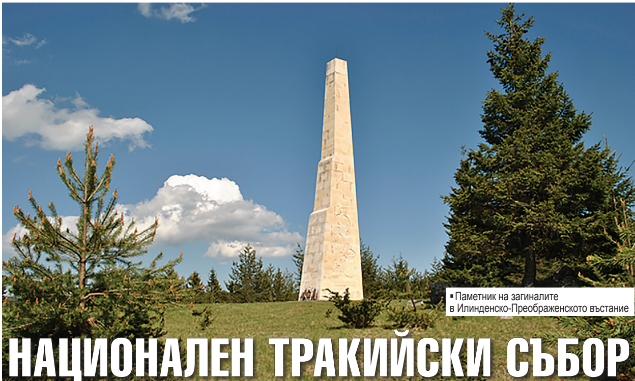
Паметник на загиналите в Илинденско-Преображенското въстание