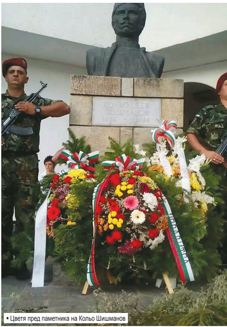
Цветя пред паметника на Кольо Шишманов

От името на СТДБ и на ТНИ бяха поднесени венци и цветя пред паметника на Илинденци и Преображенци, и пред гробовете на Пейо и Кольо Шишманови.