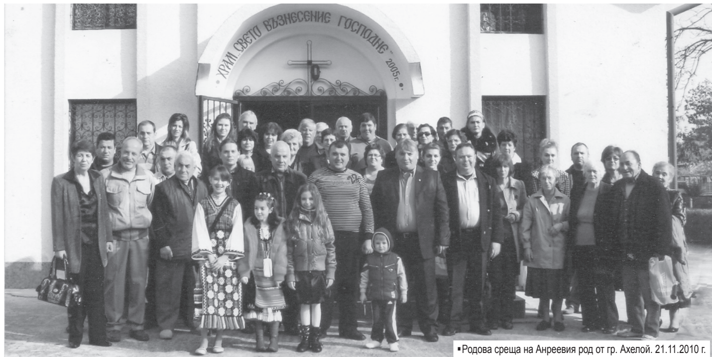
• Родова среща на Андреевия род от гр. Ахелой. 21.11.2010 г.

Това е моята разходка назад във времето, през трагедията на тракийските бежанци, която реших да споделя с вас, за да търсим и помним корените си и, вглеждайки се в миналото, да мислим за бъдещето, като пазим нашите традиции и идеали. Разказах тази история, защото искам тя да се помни, разказах я, защото съм тракийка!