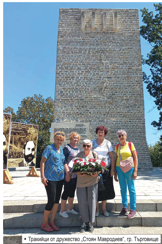
▪ Тракийци от дружество „Стоян Мавродиев“, гр. Търговище