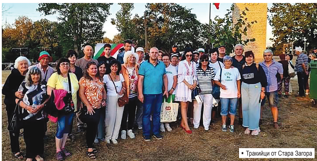
Тракийци от Стара Загора