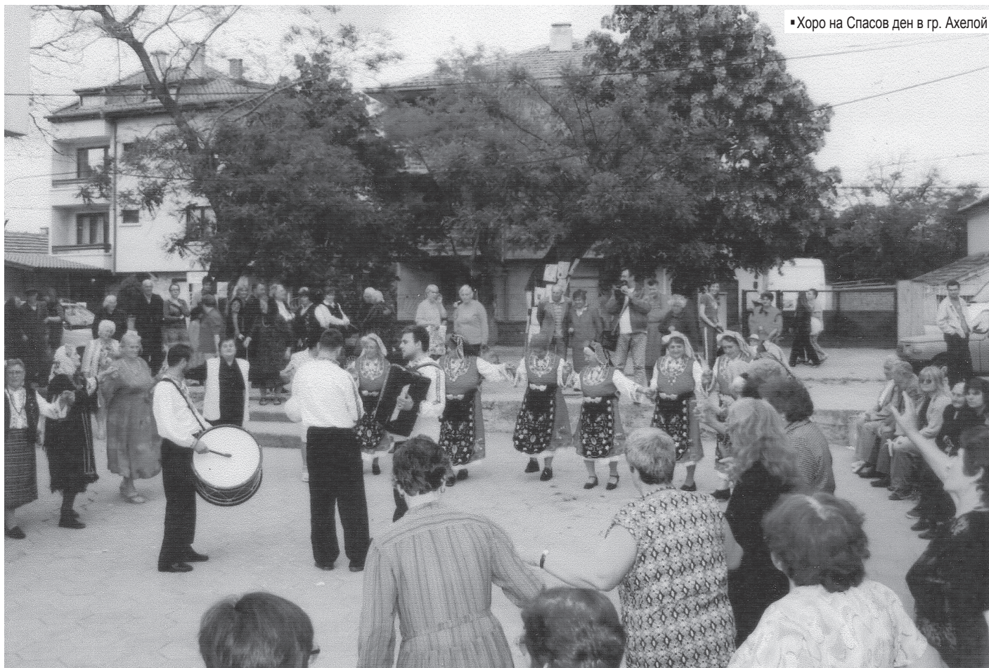
• Хоро на Спасов ден в гр. Ахелой