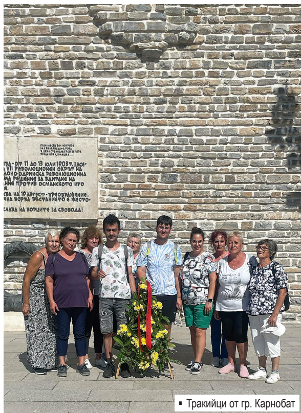
▪ Тракийци от гр. Карнобат