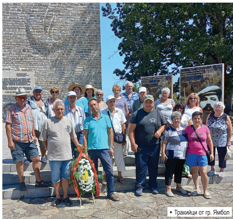
Тракийци от гр. Ямбол