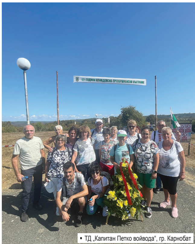
▪ ТД „Капитан Петко войвода“, гр. Карнобат