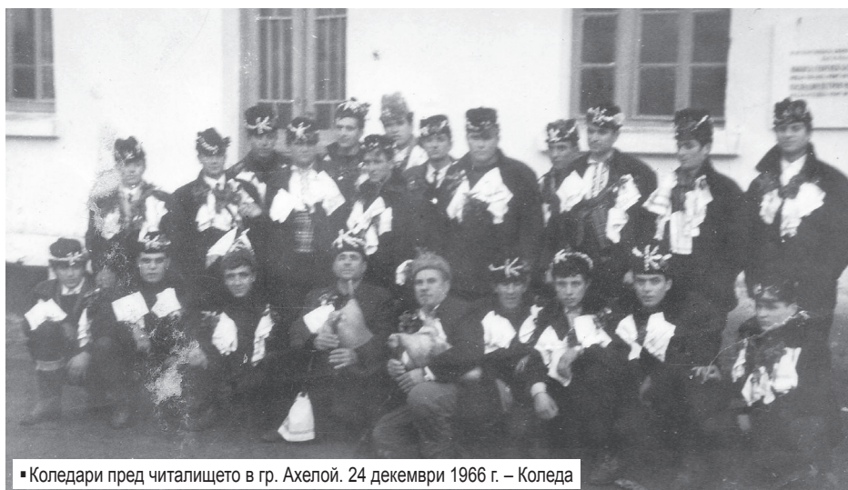
■ Коледари пред читалището в гр. Ахелой. 24 декември 1966 г. – Коледа

мъчват и бият. Претърсили ги за злато и пари. Малцина успели да скрият нещо в дрешките на децата и най-вече в сукманчетата на момиченцата, които били с двоен пояс. По-късно тези скрити пари и злато те използвали при пътуването си за България. След като измъчвали и ограбили затворените българи, турците решили да им възложат една последна задача. Наблизо имало стар кладенец, затрупан с камъни. Накарали ги да извадят камъните от кладенеца, но всъщност подготвяли тяхната гибел. Един от мъжете, носейки камъните, успял да се скрие и да избяга. Отишъл при официалната турска власт и съобщил за това, което се готвяло да направят със затворените българи. Били изпратени двама стражари. Те проявили милост към българите и им казали, че ако искат да спасят живота си, трябва да напуснат село Ахъркьой и повече да не се връщат. Всички българи от селото тръгнали отново към Чорлу. Но преди това напалили за последно фурните, опекли вкусни погачи за из път. Усетили за последно мириса на родния хляб! А зърно имало, тази година реколтата била благодатна. И така, поели по дългия бежански път с още топлия, горещ хляб в бохчите на гърбовете си. Толкова парещ бил той, че гърбовете им изгорели. Но тази болка не била толкова силна, два пъти по-силно било страданието за безвъзвратно загубеното родно огнище. Пристигнали в гр. Рехля,