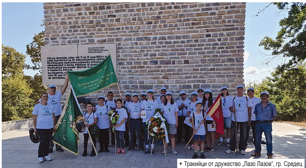
Тракийци от дружество „Лазо Лазов“, гр. Средец