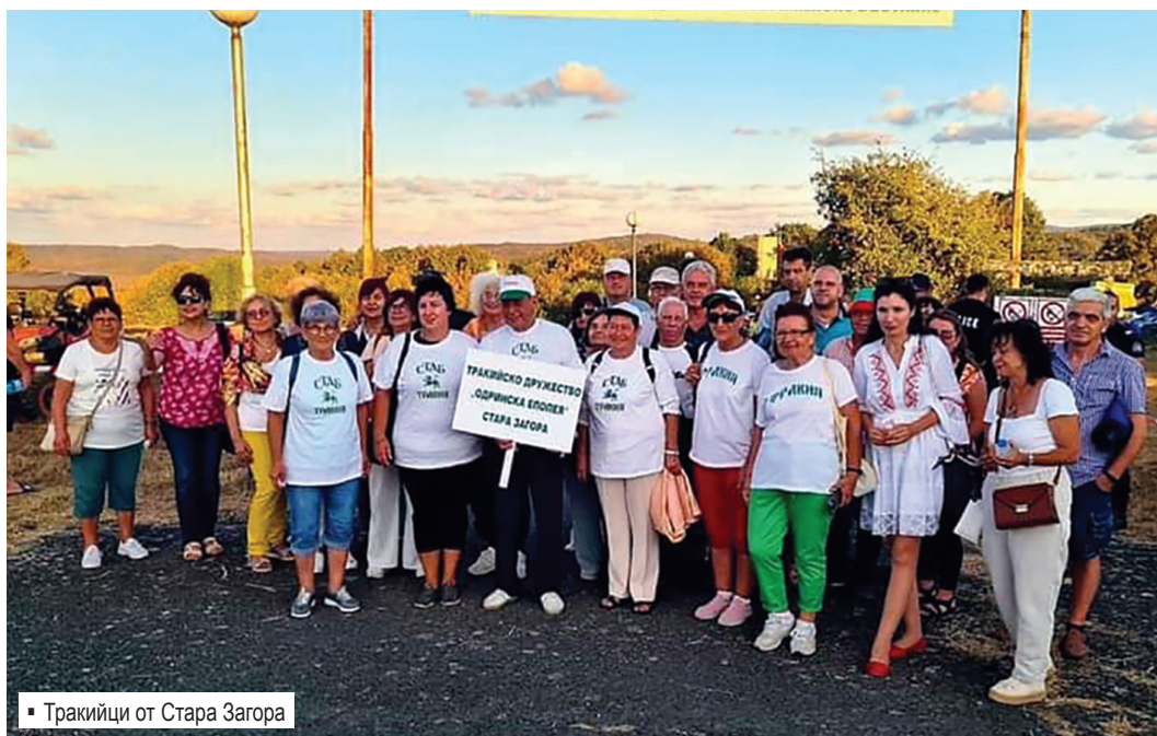
Тракийци от Стара Загора