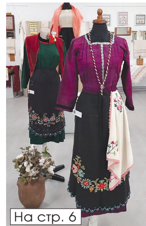
На стр. 6

Печатно издание: ISSN 1313-7611 • Онлайн издание: ISSN 2815-2638