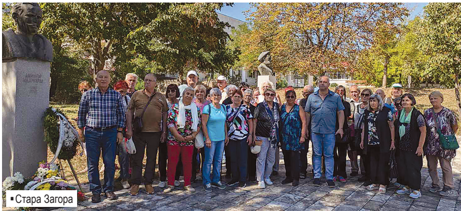
▪ Стара Загора