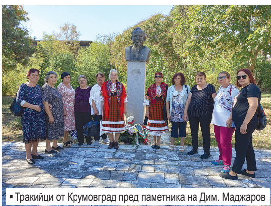
▪ Тракийци от Кривопаланка пред паметника на Дим. Маджаров