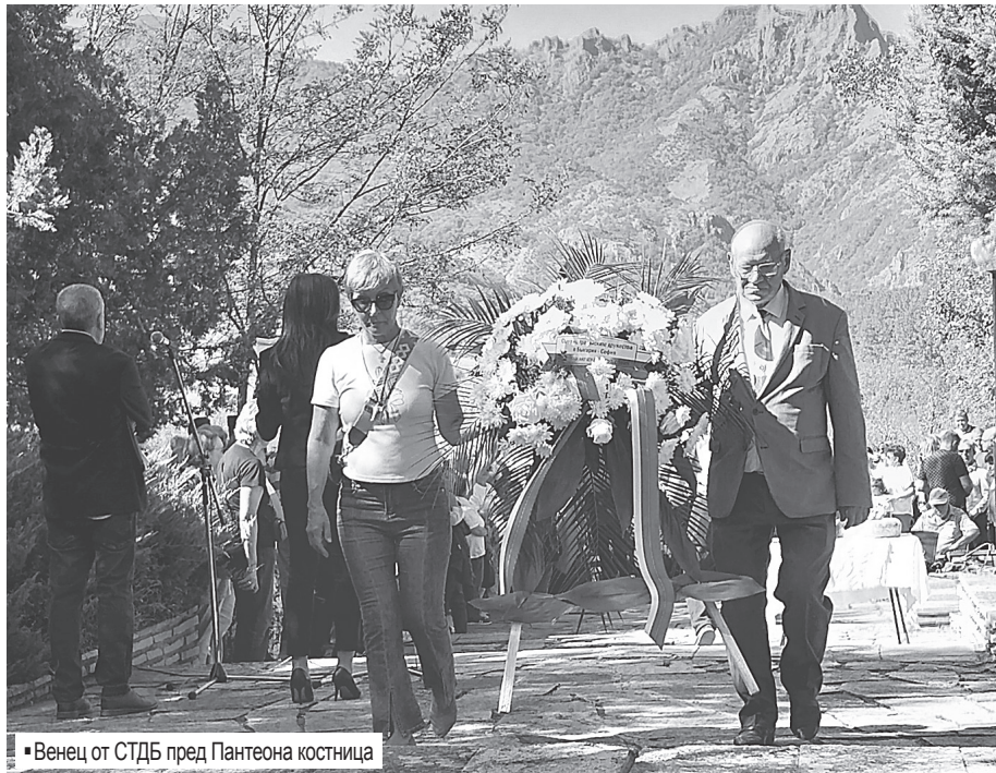
▪ Венец от СТДБ пред Пантеона костница