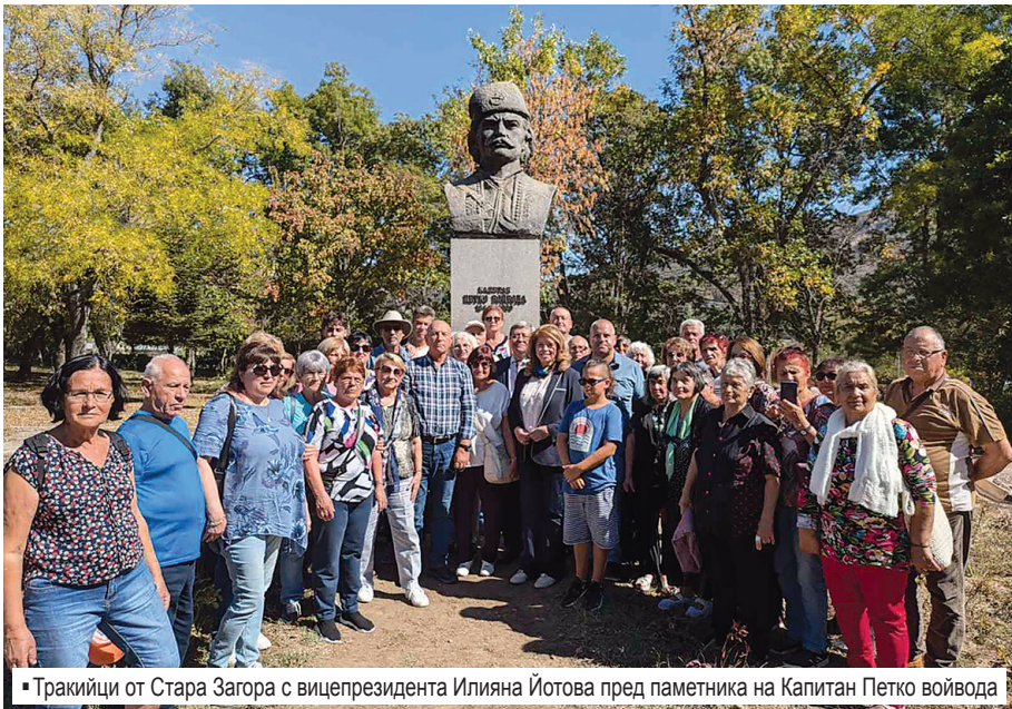
▪ Тракийци от Стара Загора с вицепрезидента Илияна Йотова пред паметника на Капитан Петко войвода