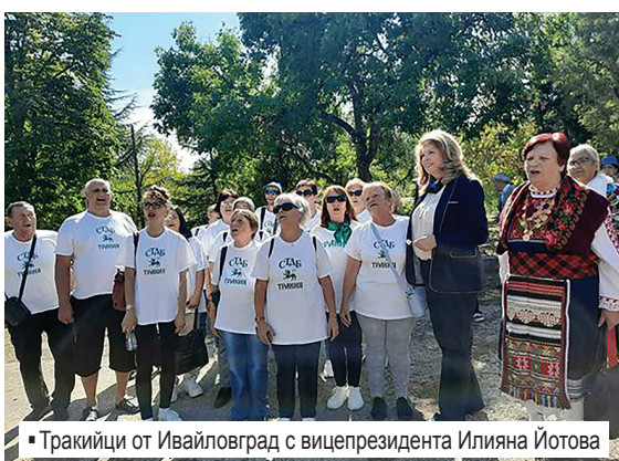
▪ Тракийци от Ивайловград с вицепрезидента Илияна Йотова