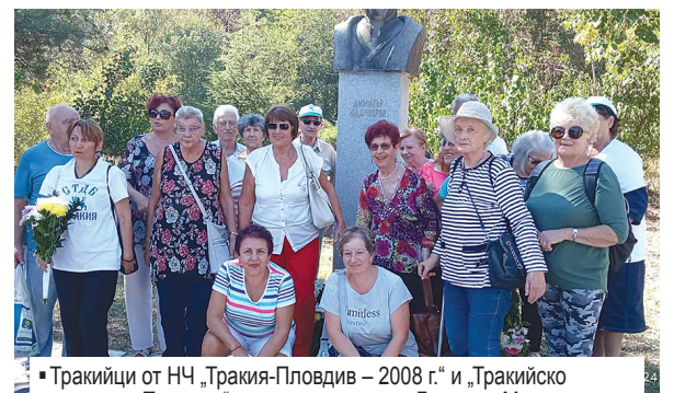
▪ Тракийци от НЧ „Тракия-Пловдив – 2008 г.“ и „Тракийско дружество-Пловдив“ пред паметника на Димитър Маджаров