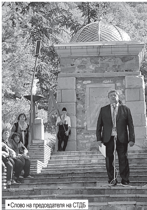
▪ Слово на председателя на СТДБ