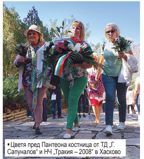
▪ Цвета пред Пантеона костница от ТД „Г. Сапуналов“ и НЧ „Тракия – 2008“ в Хасково