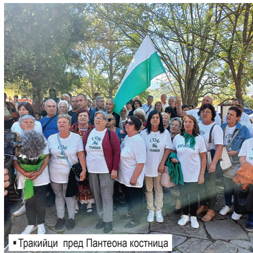
▪ Тракийци пред Пантеона костница