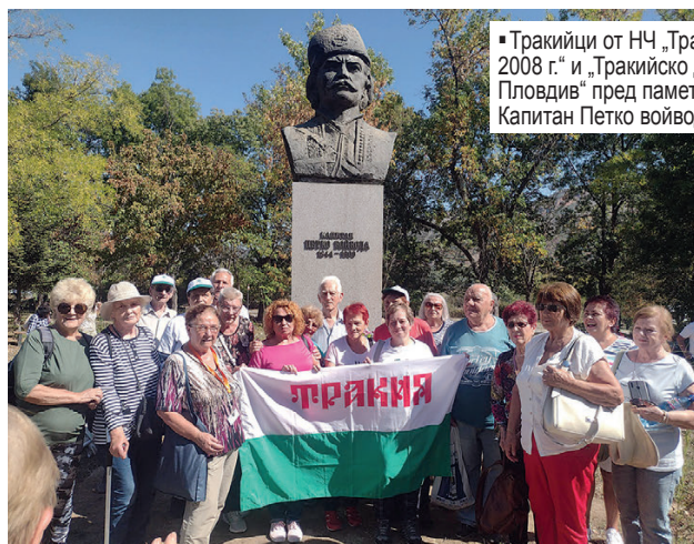
▪ Тракийци от НЧ „Тракия-Пловдив – 2008 г.“ и „Тракийско дружество-Пловдив“ пред паметника на Капитан Петко войвода