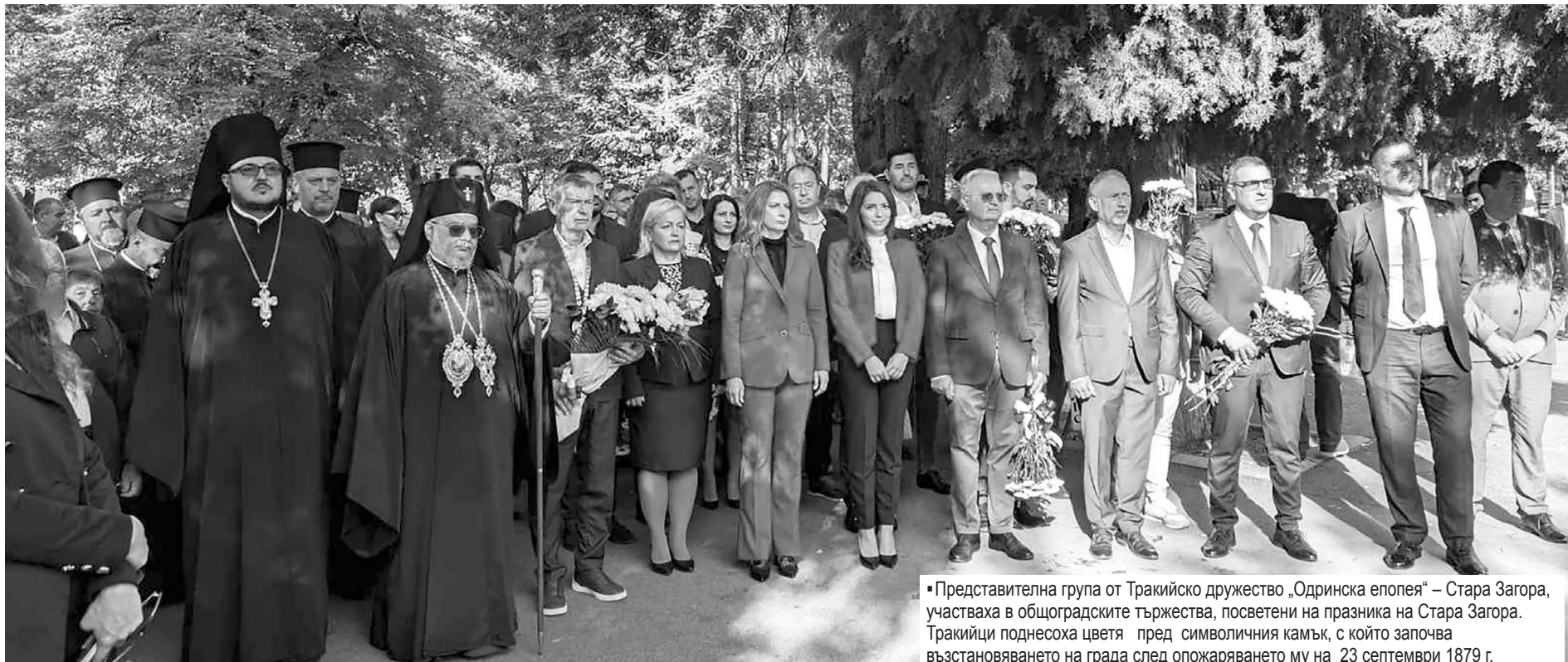
▪ Представителна група от Тракийско дружество „Одринска епопея“ – Стара Загора, участваха в общоградските тържества, посветени на празника на Стара Загора. Тракийци поднесоха цветя пред символичния камък, с който започва възстановяването на града след опожаряването му на 23 септември 1879 г.