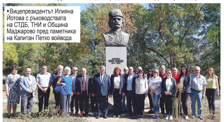
▪ Вицепрезидентът Илияна Йотова с ръководствата на СТДБ, ТНИ и Община Маджарово пред паметника на Капитан Петко войвода