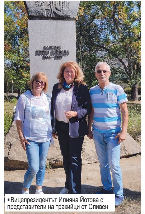
▪ Вицепрезидентът Илияна Йотова с представители на тракийци от Сливен