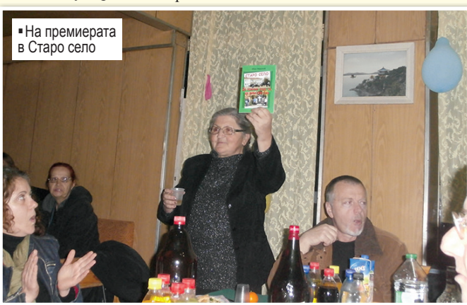
• На премиерата в Старо село

показва, че интересът към съхраняването и отстояването на тракийската идея сред млади и стари е жив. Тържеството завърши, както си му е редът, с тракийско веселие и с пожелания за още по-плодотворна 2015 година за всички тракийци и за България.