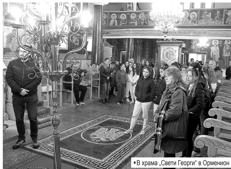
■ В храма „Свети Георги“ в Орменион