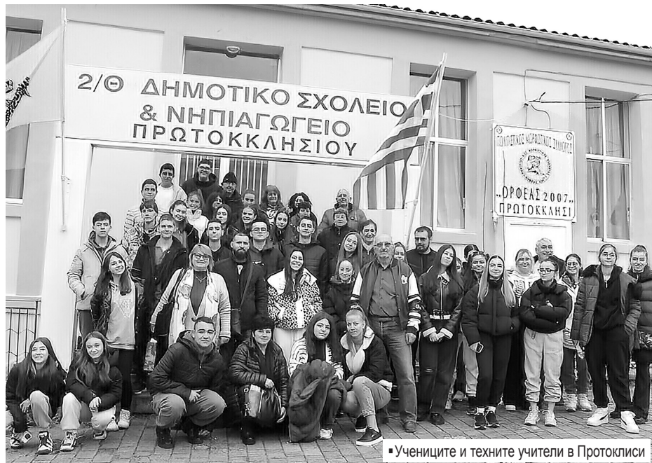
■ Учениците и техните учители в Протоклиси