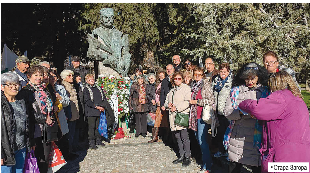
▪ Стара Загора