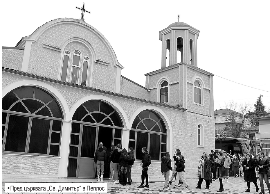
■ Пред църквата „Св. Димитър“ в Пеплос

Обогатени от интересното пътуване до родните места на дедите, сега учениците ще участват в обявения от Историческия музей в Свиленград конкурс за есе. За отличилите се са предвидени награди.