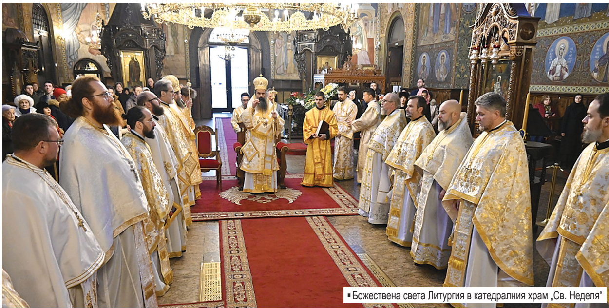
• Божествена света Литургия в катедралния храм „Св. Неделя“

На 4 януари 1878 г. руски отряд, предвождан от генерал Гурко, освобождава София от османско владичество. Превземането на града се осъществява без насилия и пожари, благодарение на бързата реакция на отряда на ген. Гурко, дал възможност за по-нататъшно настъпление на руските войски в Тракия и за прекъсване на снабдяването на турската армия с боеприпаси и продоволствия.