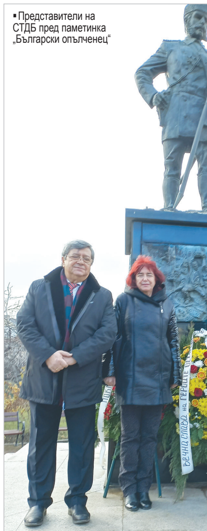
• Представители на СТДБ пред паметника „Български опълченец“

В митрополитския храм „Света Неделя“, където се е състояла първата заупокойна служба в памет на загиналите за освобождението на града, 147 години по-късно, на 4 януари 2025 г. Негово Светейшество Софийския митрополит и Български патриарх Даниил отслужи благодарствен молебен. В словото си за съхранението на паметта и благодарността, патриарх Даниил сподели: