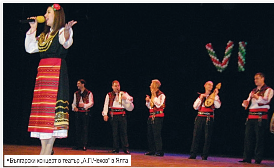
• Български концерт в театър „А.П.Чехов“ в Ялта

ни, вярвам му и съм му благодарен за съдействието при организирането на „Българските срещи“. Имаме желание да установим още по-тесни връзки с СТДБ и вече подготвяме договор за сътрудничество, който ще регламентира нашите взаимоотношения в перспектива, които са на основата на народната дипломатия.