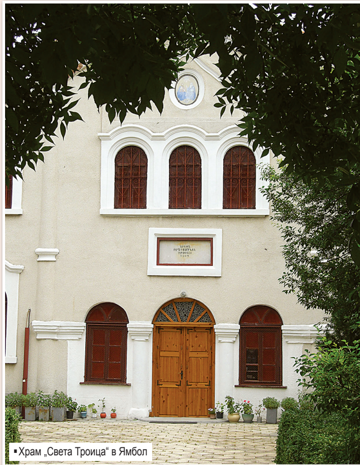
■ Храм „Света Троица“ в Ямбол

Тракийките и родствениците изслушаха с наведени глави заукойната молитва, която извърши свещеникът от черквата „Св. Троица“. Запалиха свещи и отрупаха с цветя гроба на признания и незабравен във времето народен будител.