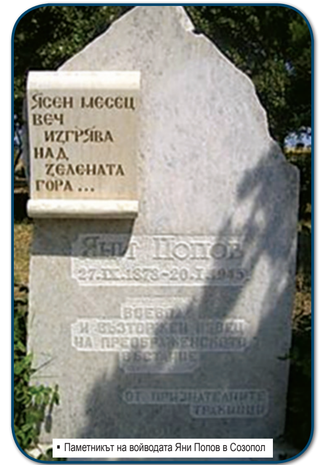
Паметникът на войводата Яни Попов в Созопол

Нали така можем да опознаем народа си и чрез неговите песни, и заради неговите песни.