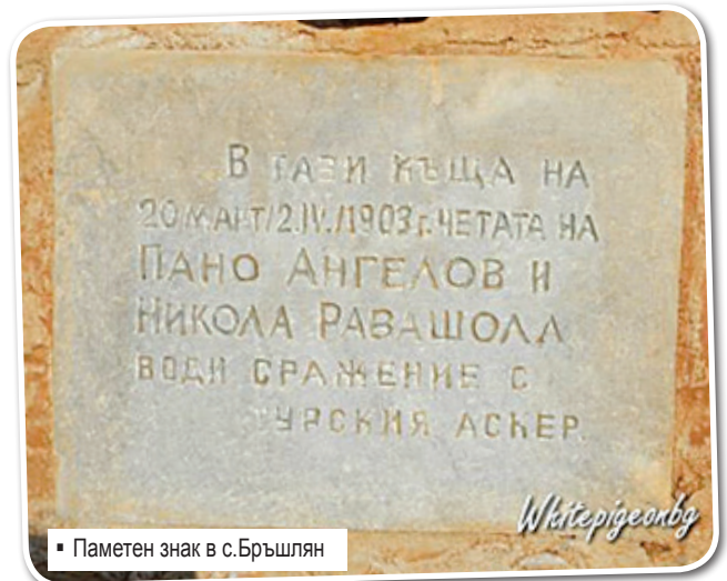
Паметен знак в с.Бръшлян

Ако чакате моя отговор – мен песните на моя народ ме привличат и с познавателната и с художествената си стойност, дават ми достоверни сведения не „за реалното състояние