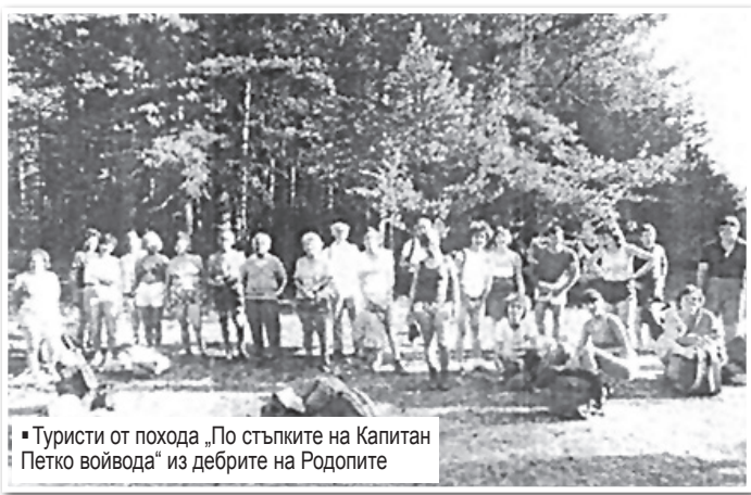
■ Туристи от похода „По стъпките на Капитан Петко войвода“ из дебрите на Родопите