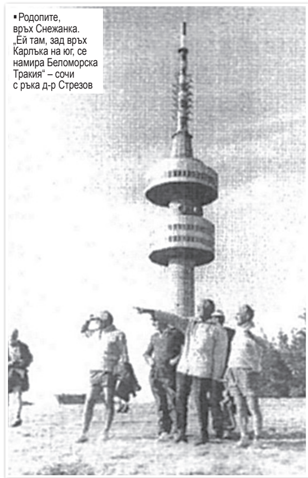
■ Родопите, връх Снежанка. „Ей там, зад връх Карлъка на юг, се намира Беломорска Тракия“ – сочи с ръка д-р Стрезов