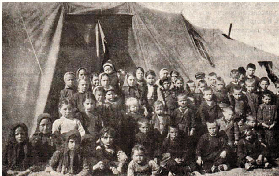
• Свиленград, 1 март 1925 г. – На палатки. Деца на тракийски бежанци от Дедеагачско, доскоро интернирани на остров Самотраки