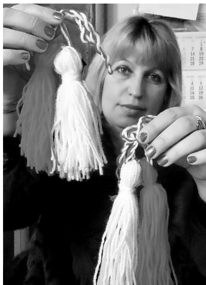
ЗЛАТКА МИХАЙЛОВА

Тракийското дружество „Георги Сапунаров“ и читалище „Тракия 2008“ в Хасково изпратиха дарение от мартеници за децата от българските неделни училища – „Отец Александър Чъкърък“ в Одрин и „Св. св. Кирил и Методий“ в Истанбул. Част от символите на пролетта, които ще зарадват учениците, са ръчно изработени на организирани седенки.