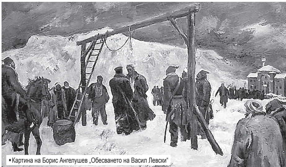
• Картина на Борис Ангелушев „Обесването на Васил Левски“

GustoMedia.bg; https://apostola.free.bg/article.html