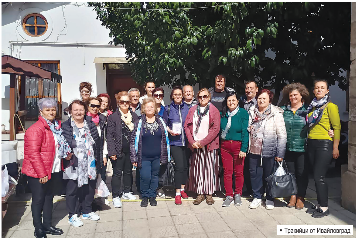
Тракийци от Ивайловград