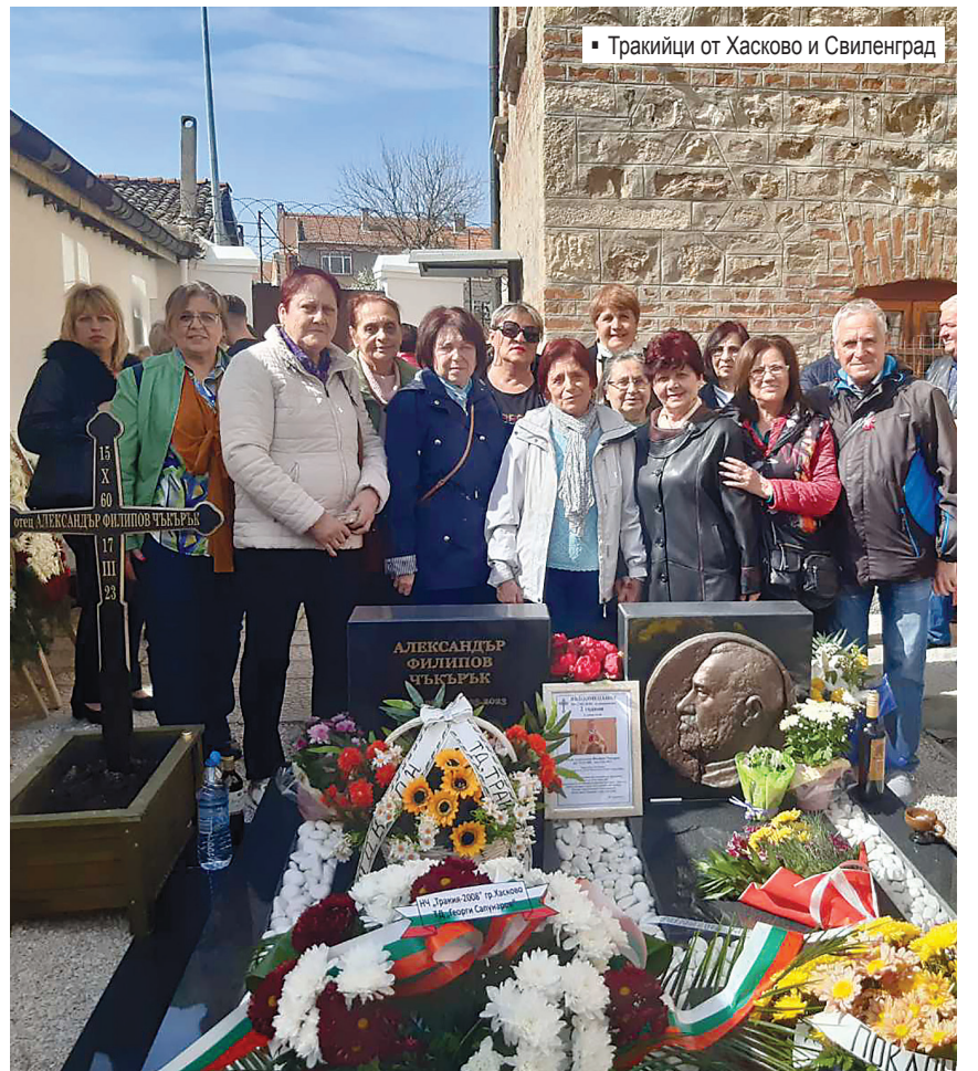
Тракийци от Хасково и Свиленград